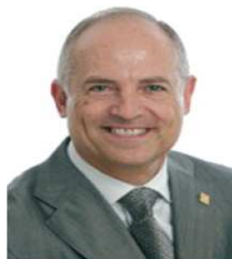
Jaume Bosch i Pugès Alcalde