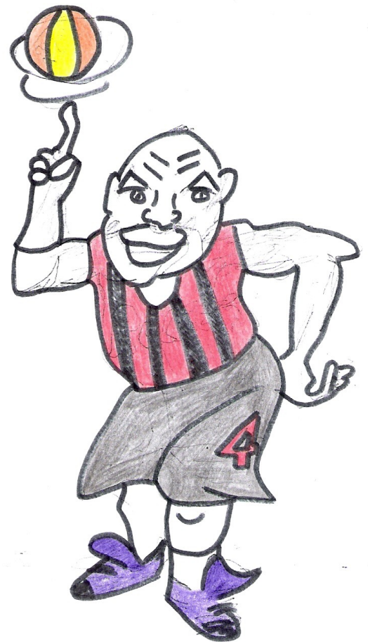
Participant Club Social Marianao